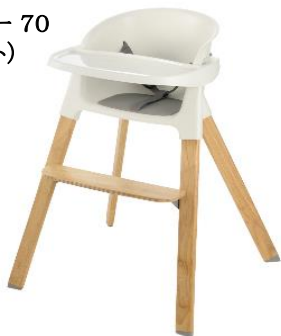
ポージー 70 (ホワイト)