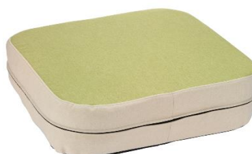
【製品 (グリーン)】 ※グリーンはトイザラス限定商品です。